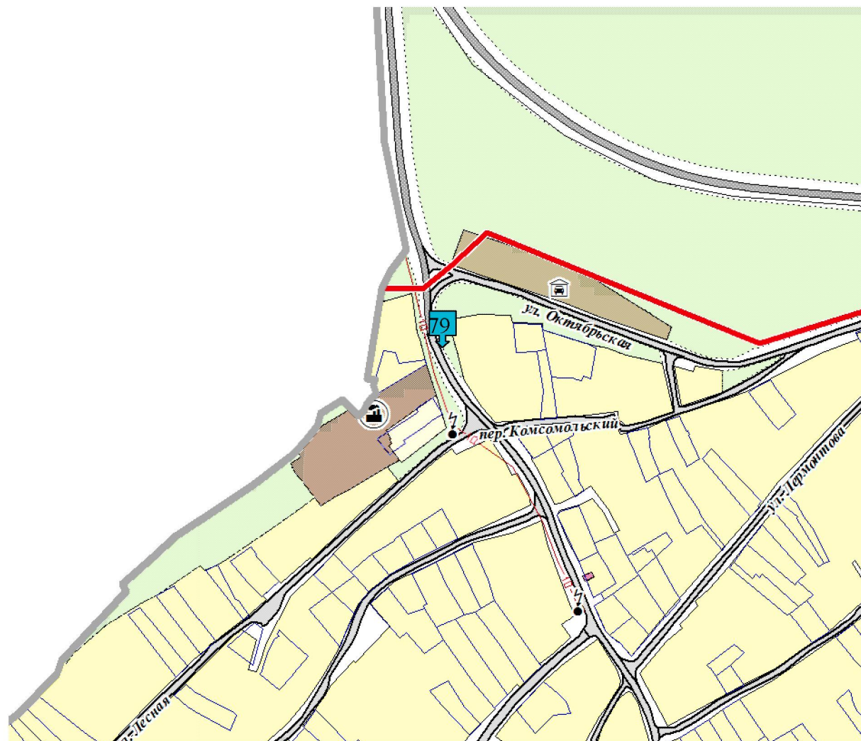
Схема размещения рекламной конструкции по ул. Октябрьская в пос. Красносельский, возле дома № 54